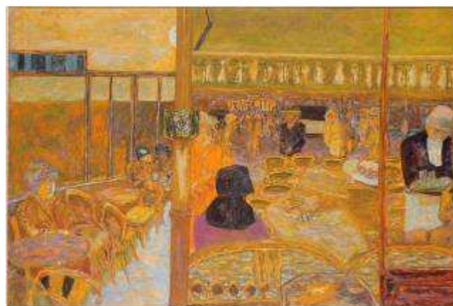
Pierre Bonnard Le café du Petit Poucet, 1928 Huile sur toile Musée des Beaux-Arts et d'Archéologie, Besançon