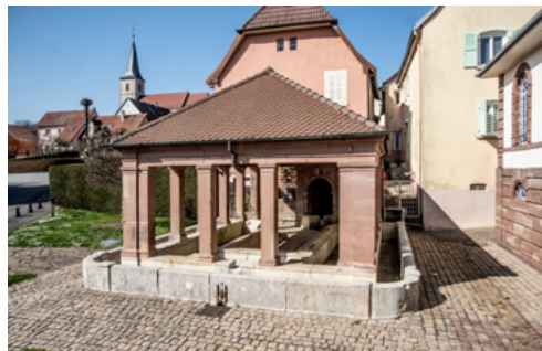
Bourogne (Territoire de Belfort)